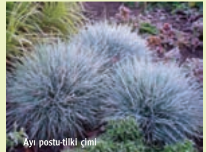
Ayı postu-tilki çimi